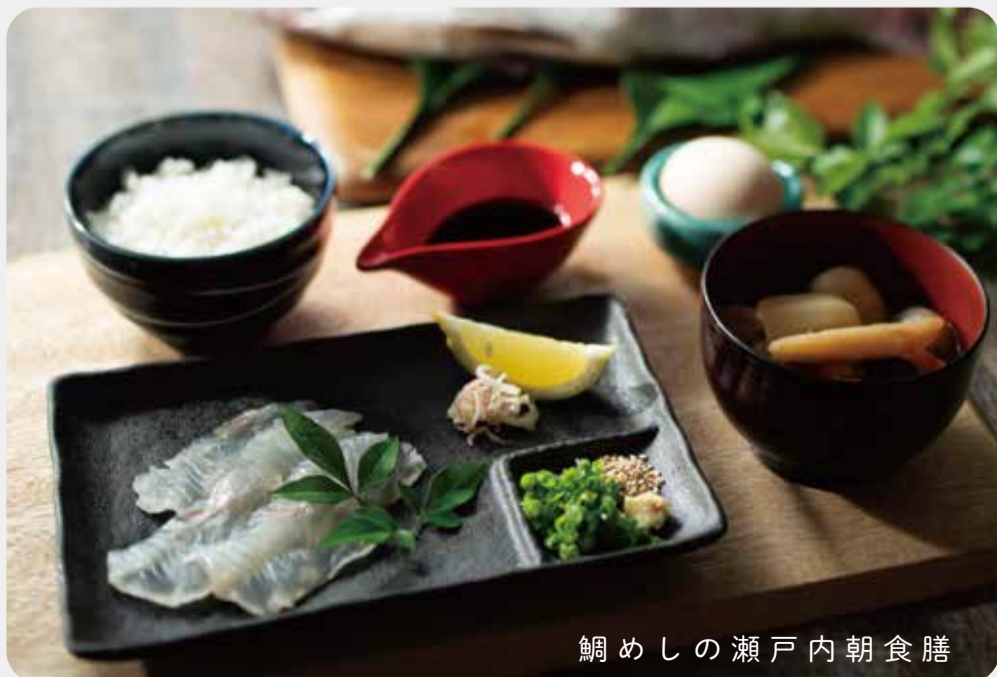
鯛めしの瀬戸内朝食膳